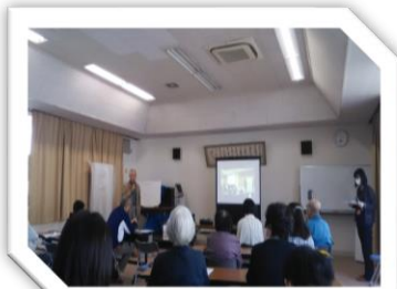
井口明神中央集会所